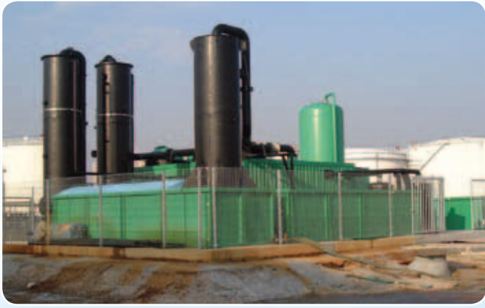
Technologická linka pro sanaci podzemních vod