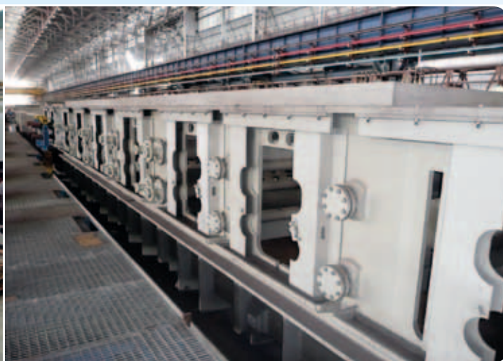
Polypropylenová mořicí linka pro galvanizovnu