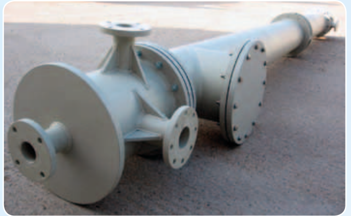
Detail plastových přírub