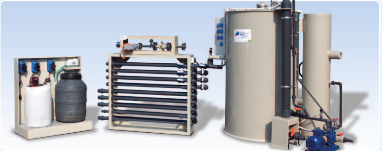
Mobilní flotační jednotka AS-FLOT