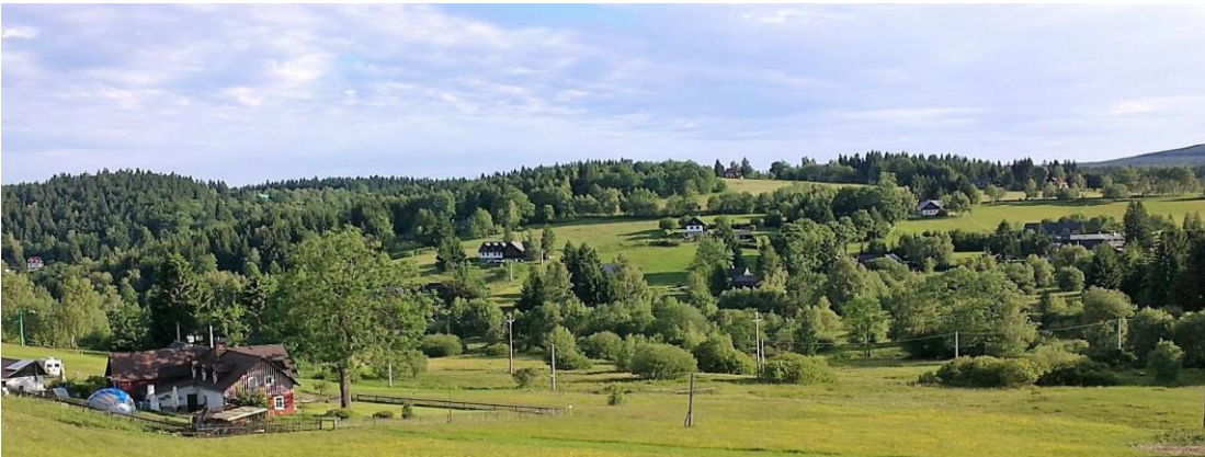
Každá lokalita je jiná....

Výběr vhodného řešení podstatně ovlivňuje náklady a následně stočné, nebo přímo náklady obyvatel. Nejlepší řešení je obvykle založené na akceptaci místních podmínek a k zpracování a vyhodnocení variantních řešení je proto vhodné přistoupit z hlediska udržitelnosti tj. zohledněním – ekonomických, ekologických a sociálních parametrů – případně začleněním dalších aspektů do hodnocení, jako je např. odolnost řešení.