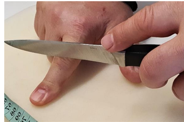
2X měř ....